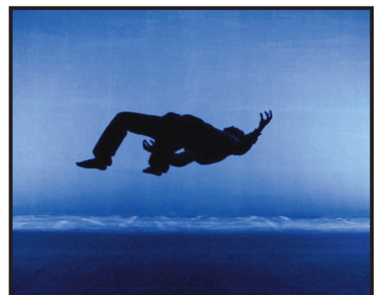
Clément Debailleul et Raphaël Navarro, Cie 14:20