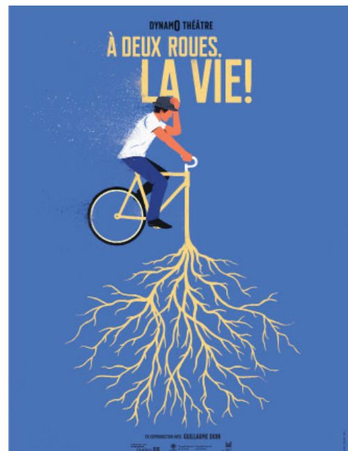
Illustration : Sébastien Thibault

Composez votre propre affiche du spectacle en vous inspirant de celle de À deux roues, la vie! . Vous pouvez illustrer un moment du spectacle qui vous a marqué. N'oubliez pas de mettre le titre de la pièce.